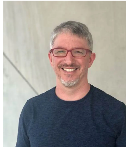
ערן טוך